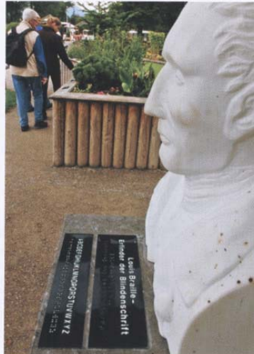
...der Tastgarten an der Wiesseer Uferpromenade ist mit Pflanzenbeschreibungen in Braille-Schrift ausgestattet.

Um das ökonomische Marktpotenzial zu erschließen, das auch in Deutschlands Topurlandsregionen erst nach und nach erkannt wird, ist vor allem eines wichtig: die anfangs von Anton Grafwallner genannte „Servicekette“. Was nützt ein barrierefreies Hotel, wenn die Beschilderung dorthin schlecht ist? Was eine Kirche mit T-Punkt für Gehörlose, wenn die touristischen Mitarbeiter davon nichts wissen? Die Servicekette beschreibt